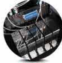
Boya Tipi Dispers, Hibrit Sublimasyon, Asit