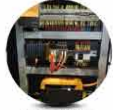
Alman Teknolojisi Robotik Kontrol Sistemleri