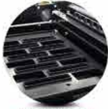
Patentli Otomatik Kafa Temizleme Sistemi