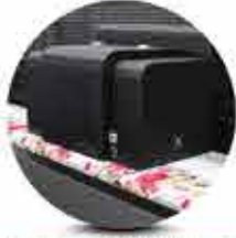
Endüstriyel Baskı Kafaları 5-14 Piköltre Ayarlanabilir Damla Hacimleri